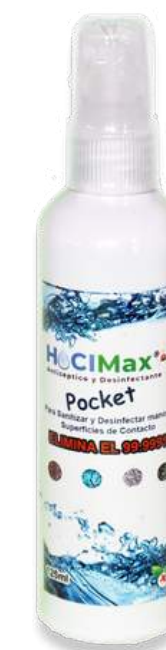
HOCIMax Pocket 125 ml