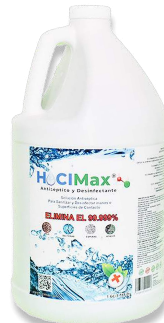
HOCIMax Galon 3.785 Lt.