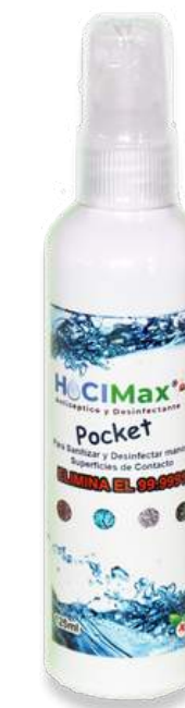
HOCIMax Pocket 125 ml