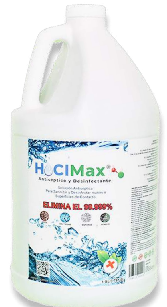
HOCIMax Galon 3.785 Lt.